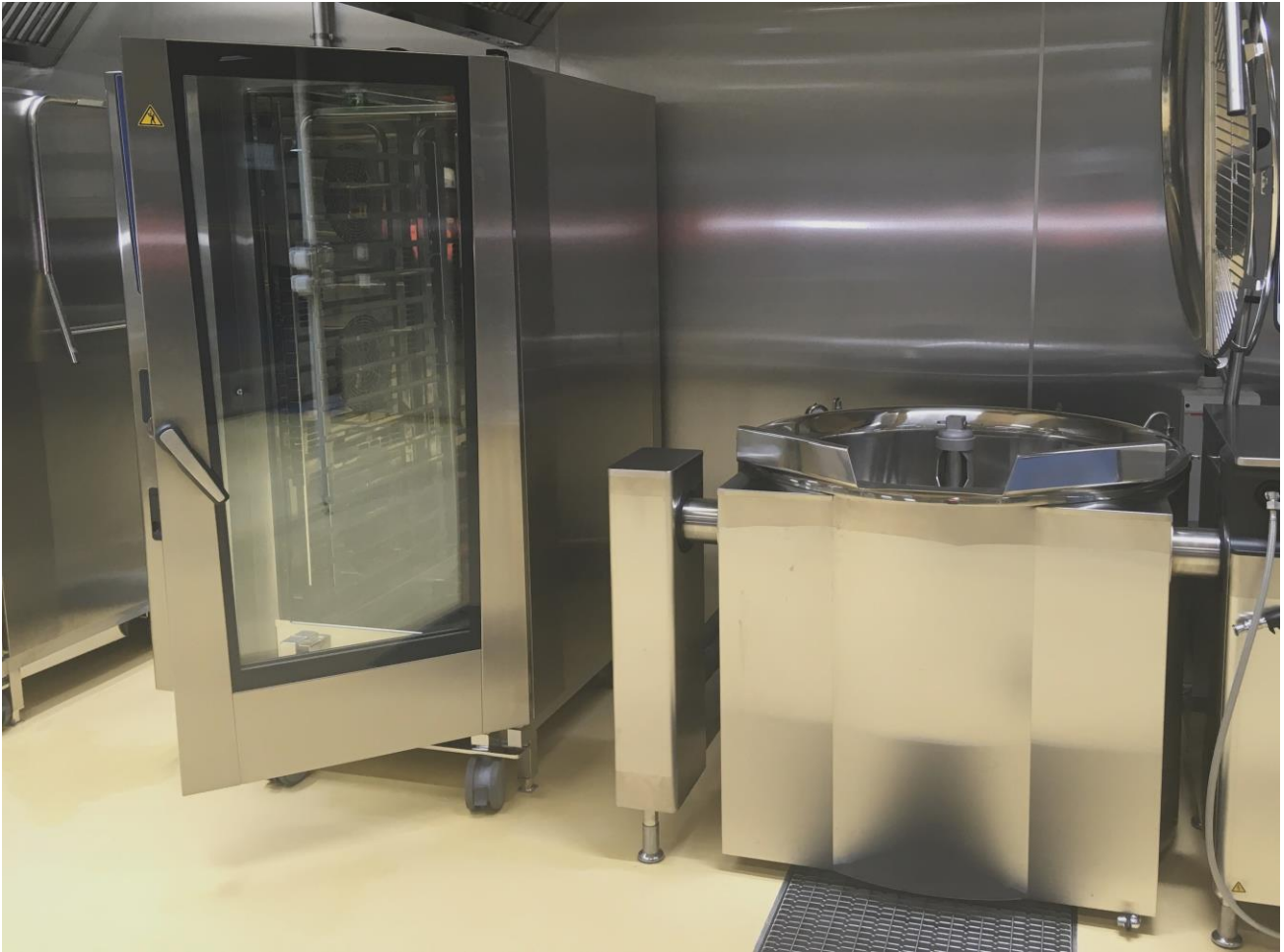
Uuden keskuskeittiön uutta kalustoa