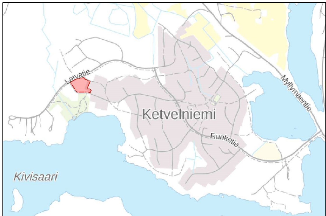
Kuva 1 Suunnittelualueen rajaus

Suunnittelualue on pinta-alaltaan noin 0,9 ha.