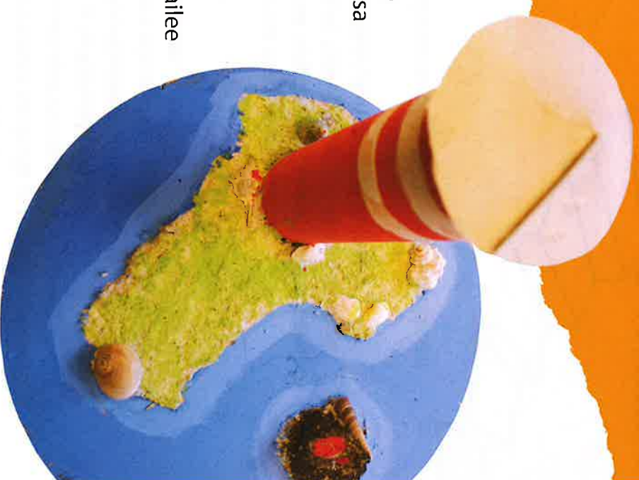
Tekijä: Ida Heikkilä

Toteutus: kevätlukukausi, ohjausryhmä suunnittelee sisällöt.