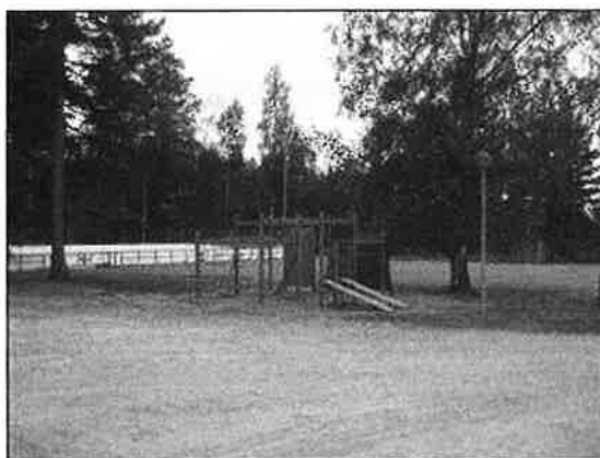
(Nina Moilanen 6.9.2012)