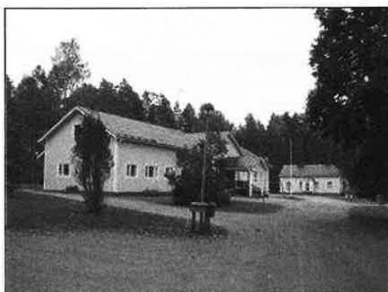
(Nina Moilanen 6.9.2012)