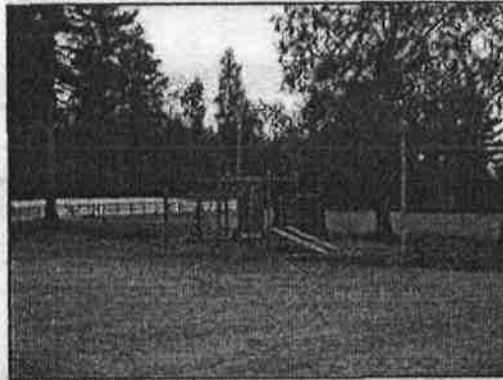
(Nina Moilanen 6.9.2012)