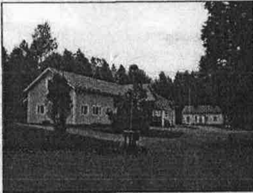
(Nina Moilanen 6.9.2012)