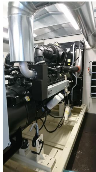
Jaakonsuon jätevedenpuhdistamo