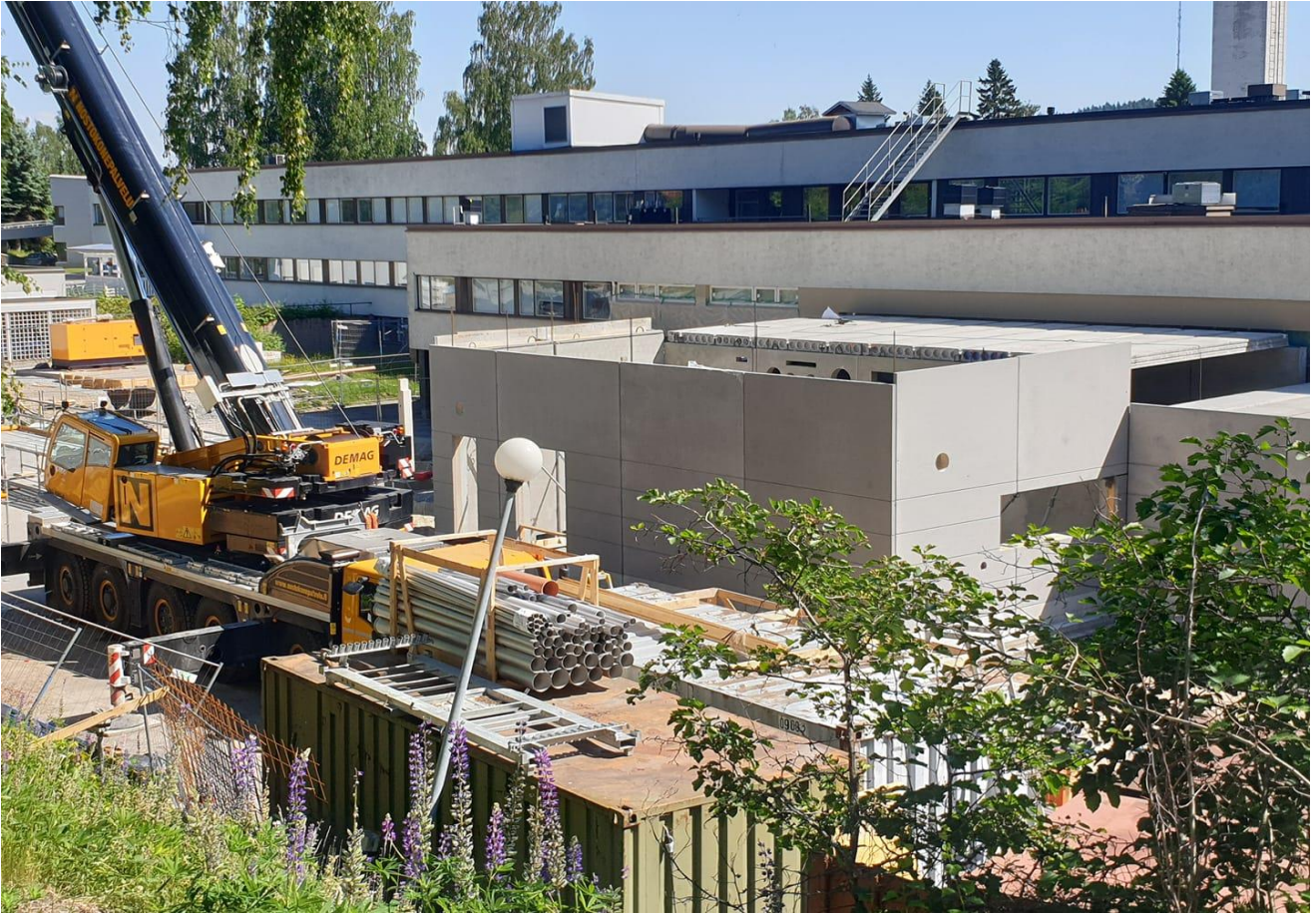
Uuden keskuskeittiön laajennus ja saneeraus